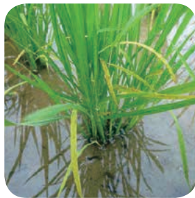
有害ガスによる生育状況 (下葉が黄色化、分けつ低下)