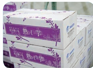
特製「熟し芋」ダンボールで 出荷します