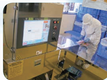
X線検査後、 目視でもチェック!!