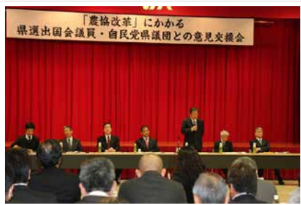
1月17日に実施した県選出国会議員・自民党県議団との意見交換の様子

3. 信用事業の分離 地域実態に応じた各種借入れや農業関連施設を利用できなくなる可能性があります。また、営農指導を受けるには応分の費用負担が必要となる可能性があります。