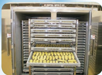
「真空乾燥機」で70℃、 8~9時間乾燥