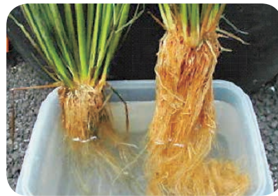
(発根の比較) 左：有害ガス被害株 右：健全株