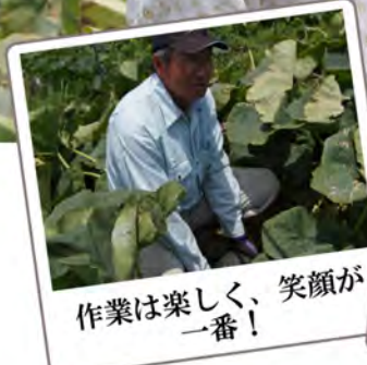
作業は楽しく、笑顔が一番!