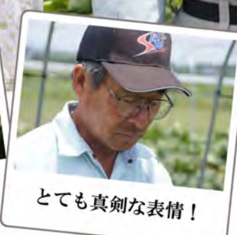
とても真剣な表情!

られたからだそうです。それから25年経った現在もカボチャの栽培を続けており、「JAあおぞらカボチャ部会」の部長も務めています。自分が部会長のうちに「販売額1億円達成したい」と夢も語ってくれました。病気予防のためにシートを敷いたり、新聞紙でカボチャを包み、日焼け防止などの対策も夫婦二人でしているそうです。「毎年ミツバチが減ってきてるんだよね」と頭を悩ませることもあるそうで、環境問題にも敏感になっているようでした。「カボチャ栽培で気を付けていることは？」の質問に「自然が相手だから、春先は防霜対策をするし、雨が多い時期には排水対策、夏には台風対策もしないといけない。でも、カボチャが日に日に大きくなるのが楽しみなんだよ。」と笑顔で語ってくれました。結婚されてから夫婦二人三脚で農業を営んできましたが、これからも夫婦仲良く楽しみながら農業を続けていくそうです。